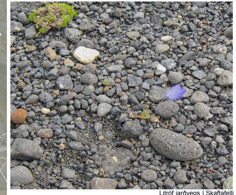
Litróf jarvegs í Skaftafelli

Ásýnd byggðar Frá árinu 1990 hefur sjálfvaxinn skógur breitt úr sér á söndunum sunnan Bæjarstaðarskógar. Á rúmunni tveimur áratugum hefur ásýnd landsins gjörbreytt, gróðinnar sandanna hafa víkið fyrir grænni silki sem sume stíðar er orðin að skógarbelti. Þessi umbreyting mun halda áfram á næstu árum með meiri krafti en áður þar sem birkfiræði þarf nú ekki lengur að fara um langan veg heldur kemur beint af lóðinni. Sú byggð sem nú er skipulögð mun að öllum líkindum hverfa í birkiskógi á komandi árum og verða lítt áberandi frá vegi og þjóðgarðinum. Sýnileikinn verður einna mestur úr Skaftafellshöfni á þeim mánuðum ársins þegar trjágreinar eru berar. Því er mikilvægt að huga að þakformi, byggingarefnum og samræmdum útlitseknum.