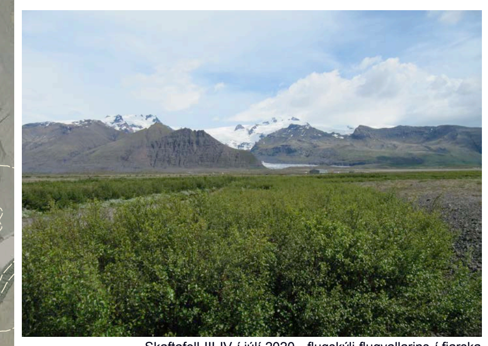
Skaftafell III-IV í júlí 2020 - flugsýni flugvallarins í fjaraska